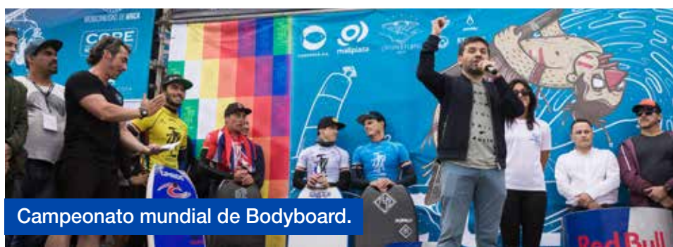
Campeonato mundial de Bodyboard.