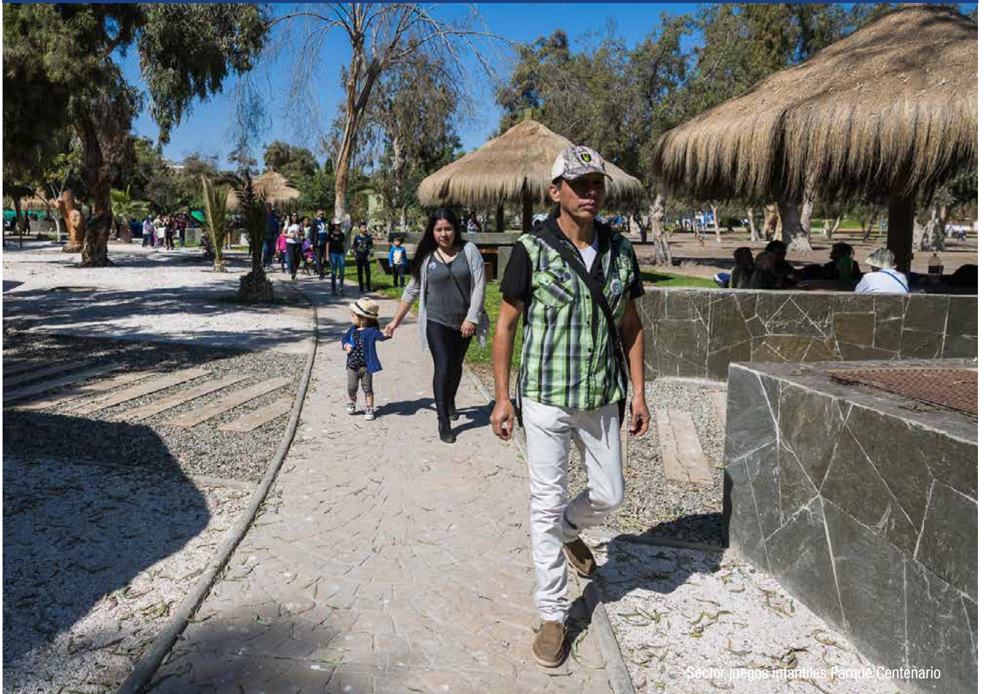
Sector juegos infantiles Parque Centenario

DISTRIBUCIÓN GRATUITA · PROHIBIDA SU VENTA