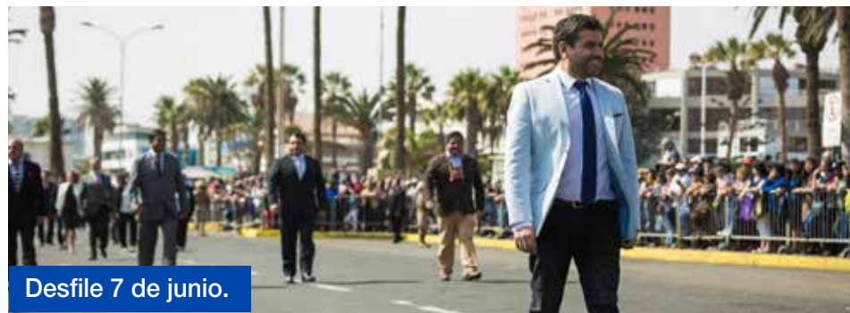
Desfile 7 de junio.