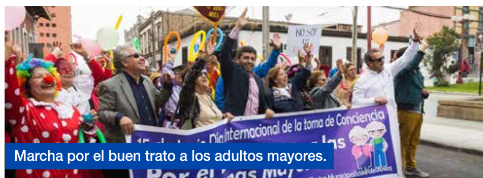
Marcha por el buen trato a los adultos mayores.